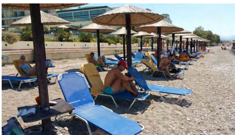
On the beach

Nach dem geruhsamen Nachmittag schnell zurück aufs Zimmer und sich herausputzen für den Ausgang. Kurzer Fussmarsch der Strandpromenade entlang zum „Griechen“ ins Restaurant Maistrali Taverna, sehr empfehlenswert. Die ganze Mannschaft mit Anhang an einem Tisch versammelt, da kommt familiäre Stimmung auf. Diese Abende sorgten für die gute Stimmung und die Harmonie in unserem Team.