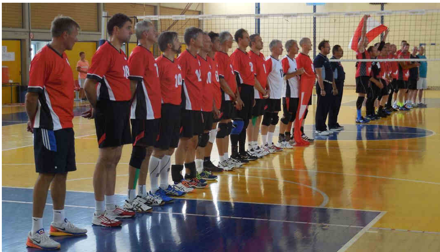
Stolze Schweizer Seniorennati vor dem Bronze Spiel beim Singen der Nationalhymne

In der Halle angekommen sofort Vorbereitungen für die kommenden Spiele treffen und wenn nötig Medical Staff beanspruchen. Aufwärmen und Einspielen (bei knapp 30°) so gewissenhaft wie möglich. Give Aways für die Gegner mitnehmen (Schweizer Schokolade) und aufreihen an der Seitenlinie zur Präsentation der Schiedsrichter und Mannschaften. Handshake und Übergabe der Schokoladen an die Schiedsrichter und gegnerische Mannschaft. Letzte Anweisungen vom Trainer Andreas verinnerlichen und auf in den Kampf.