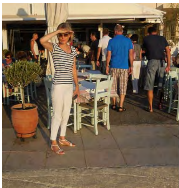
Wo bleibt nur mein Mann, ich habe Hunger

Nach dem geruhsamen Nachmittag schnell zurück aufs Zimmer und sich herausputzen für den Ausgang. Kurzer Fussmarsch der Strandpromenade entlang zum „Griechen“ ins Restaurant Maistrali Taverna, sehr empfehlenswert. Die ganze Mannschaft mit Anhang an einem Tisch versammelt, da kommt familiäre Stimmung auf. Diese Abende sorgten für die gute Stimmung und die Harmonie in unserem Team.