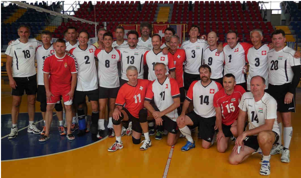
Schweiz – Ungarn, welche sich zum ersten Mal an einem Turnier gegenüber gestanden sind